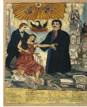
Theofilos de Lesvos, “Rigas Veles-tinlis ve Adamantios Korais Yunanistan'ı ayağa kaldırıyor”, Macedonian Museum of Contemporary Art, http://www.eikastikon.gr/zografiki/theofilos.html