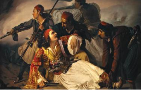
Ludovico Lipparini, “Marko Bocharis’in Ölümü”, 1841, Trieste, Civici Musei di Storia ed Arte, https://www.radiofrance.fr/franceculture/podcasts/le-cours-de-l-histoire/1821-la-grece-lutte-l-europe-exulte-3412035