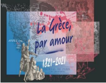
“La Grèce par amour, 1821-2021”, Sanal sergi afişi, https://1821.ifg.gr/