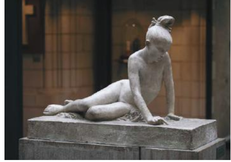
David d'Angers, “La Jeune Grecque”, 1827-34, Musée d'Angers, https://musees.angers.fr/collections/incontournables/incontournable/5-la-jeune-grecque-au-tombeau-de-marco-botzaris-pierre-jean-david-dit-david-dangers/index.html